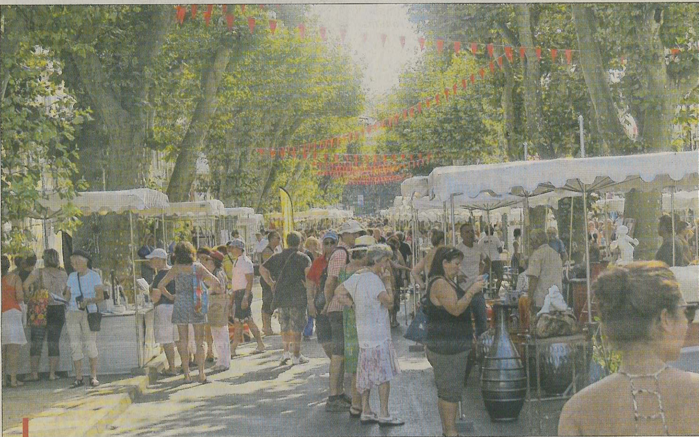
Quelque 100 000 visiteurs ont déambulé autour des 200 stands de céramistes pendant le week-end.